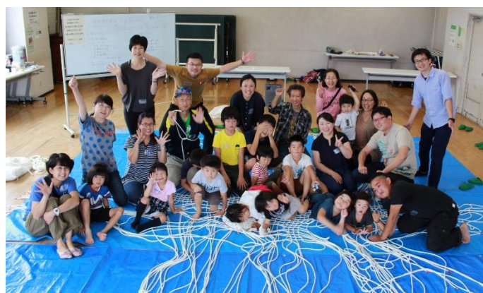
ハンモック講座参加のみなさん(大袋地区センターにて)。講師はプレーリーダー みたける&とっきー。出来上がりが楽しみ!

『ハンモックってこうやって編むの!?!』とびっくり。よじってあるロープを緩め、そこにもう1本のロープを通していくのですが。ぜひあなたにも編んでもらいたいです。夢中になります。みんなで作る遊具なんて最高ですね。大袋プレーパークで引き続き編み続けます。編み方キットもあるのでお試しを。(かなもん)