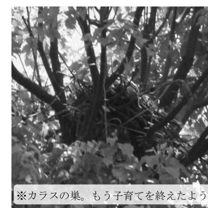
※カラスの巣。もう子育てを終えたよう