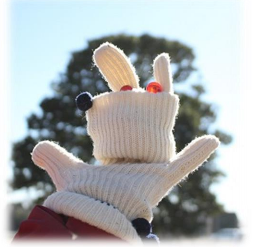
手袋でうさぎさん/1月

大変な時期だからこそ、育児を頑張っている人たちに寄り添うことができる、そんな活動をこれからも大切にしていきたいと思います。(とまと)