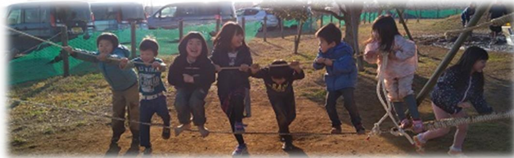
モンキーロープで遊ぶ子どもたち 大袋プレーパーク・2020年1月

常設プレーパークの実現の可能性がでてきたのが、2011年でした。西大袋の区画整備事業の中に総合公園をつくる計画があり、その一角を暫定的に「プレーパーク」として使用してはどうかとの提案が越谷市からありました。これでいよいよ常設のプレーパークができると期待をしていたところ、道路整備などの西大袋整備事業全体に遅れが生じ、総合公園をつくる計画もかなり先送りとなっていました。