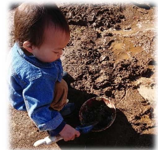
どろんこあそび/2月