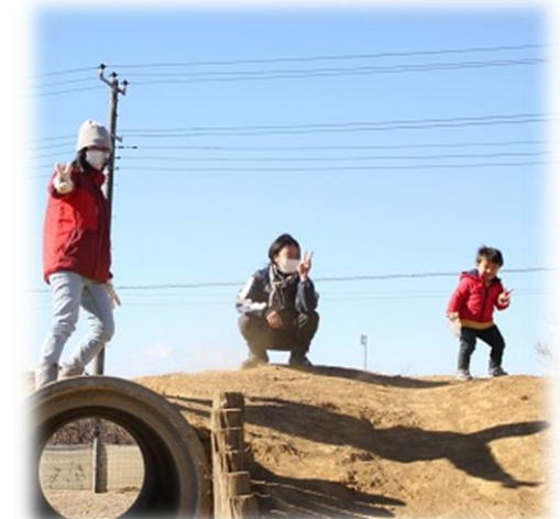
強風で寒かったけれど、リフレッシュ/1月