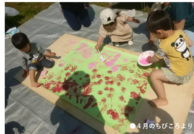
●4月のちびころより

テーマこそあれ、やはりちびころの醍醐味はその自由さにあります。ピンクや赤のスタンプの中に真っ青な絵の具が投入されたり、ちぎり絵用ののりを大量に出してその感触を楽しみ始めたり…。どんな風に遊びが展開していくかなとある程度予想はしていますが、いつもその予想を超えた遊びを見せてくれる子どもたちにびっくりします。