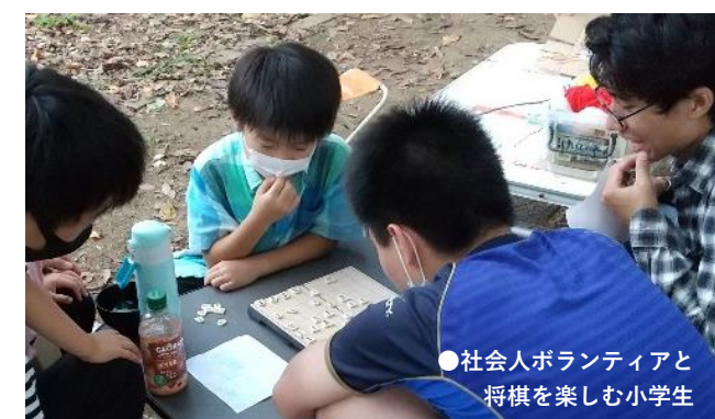
●社会人ボランティアと将棋を楽しむ小学生

れていきたいと思っています。また室内で遊ぶようなカードゲーム(トランプやUNOなど)や手芸(ビーズや毛糸)なども屋外するのが「新鮮」と子供たちの声が聞こえてきたので用意しようと思っています。それから季節感のある遊び(水や草木)、もちろん体を使って鬼ごっこや縄跳びなども。それぞれの指導員とボランティア学生が自分の得意な遊びで子供たちと楽しみながら開催します。(川)