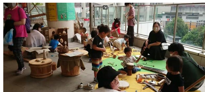
●オリジナルカーにはたくさんの遊び道具。夢中になって遊ぶ参加者。

私たちの団体は子どもの外遊びの機会が減少傾向になっていることに危惧し、子どもにとっての遊びの必要性、特に屋外での五感をつかった遊びの大切さを多くの人に知ってもらい、子どもの豊かな遊び環境を守りたいと願って2002年に発足しました。活動を始めてから早いもので20年が経過しました。この間に子どもの貧困や生きにくさを抱えた子どもたちの自殺の増加が社会問題となり、また学校や家庭に居場所を見いだせない子どもたちが増え、ますます子どもを巡る環境は悪くなっているように思えました。特に2019年に発生した新型コロナウイルスの感染拡大が子どもたちの活動に制限をかけ、自由な遊びの機会を奪っているように思えます。